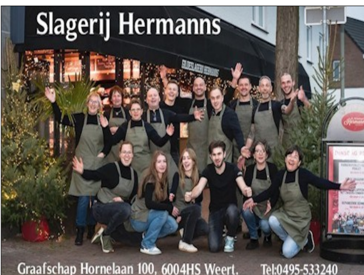
Graafschap Hornelaan 100, 6004HS Weert. Tel:0495-533240

Woensdag 19 augustus einde zomervakantie 'Friet op het plein'