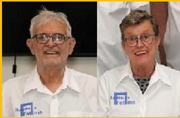
Jan Cup & Katrien Cup